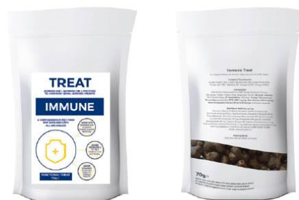
Disegni di Etichette Campione a scopo illustrativo