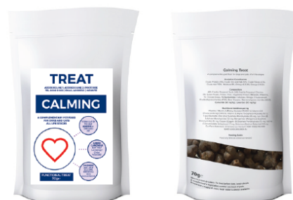
Disegni di Etichette Campione a scopo illustrativo