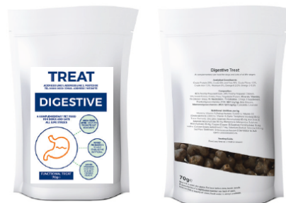
Disegni di Etichette Campione a scopo illustrativo